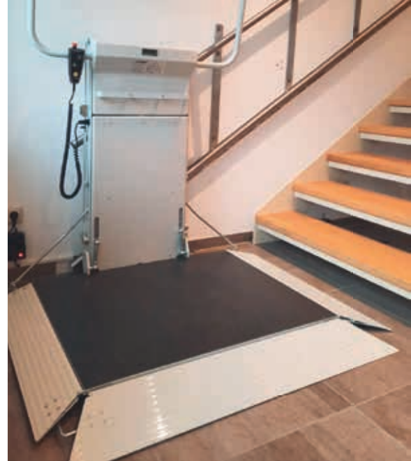
Geringe Plattformhöhe und eine 90° Auffahrrampe sorgen für einfachen Zugang an der unteren Haltestelle