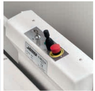
Joystick auf der Plattform als alternative Bedienoption