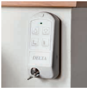
Funkfernbedienungen können als Handkassette verwendet oder an die Wand montiert werden