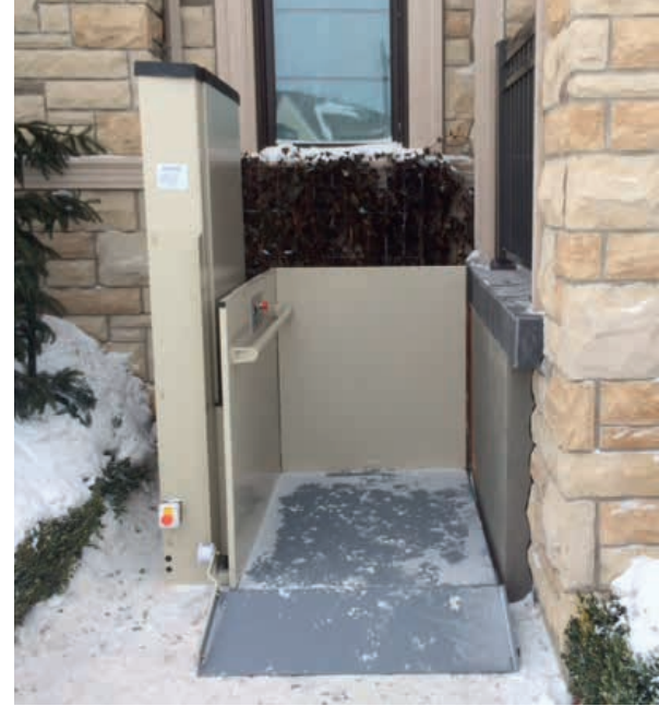
Obere Tür integriert in Geländer