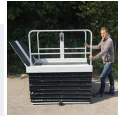
Option: Transporträder ideal für unterschiedliche Einsatzorte