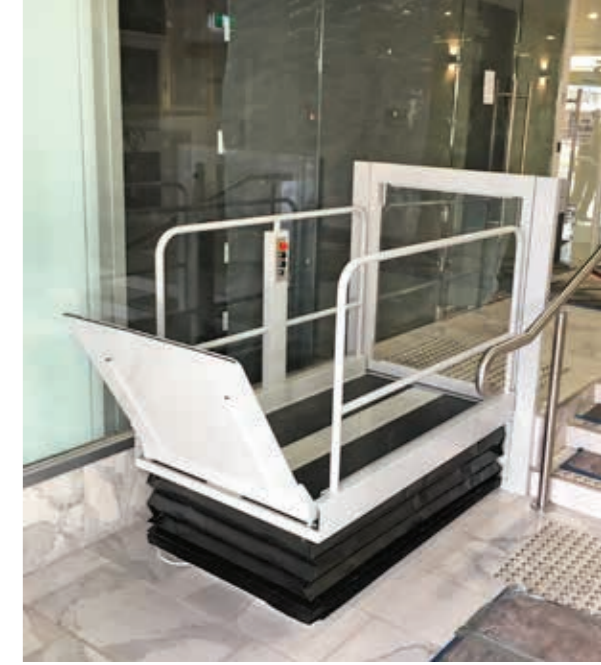
Version mit Tür an oberer Haltestelle , erhöhten Barrieren und Bediensäule