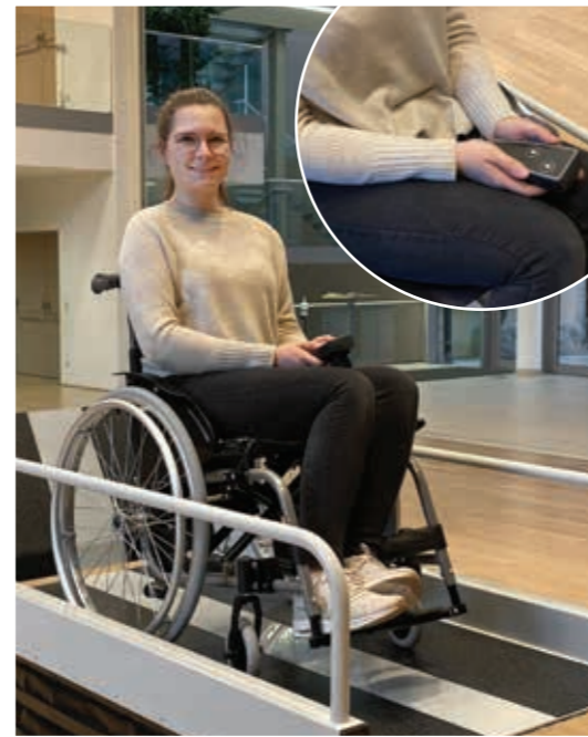
Handkassette an einem Spiralkabel für komfortable Bedienung