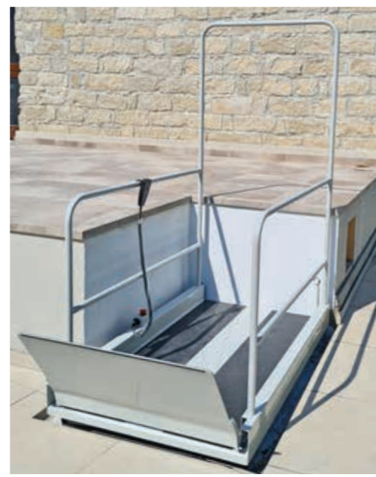
Außeninstallation für temporäre oder permanente Nutzung