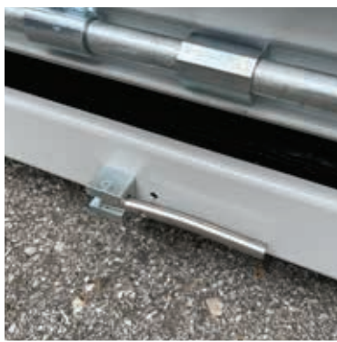
La sécurité est la priorité absolue : Cela est garanti par la descente d'urgence