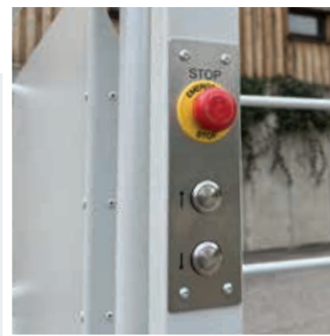
Commande de la plateforme comprenant un bouton d'arrêt