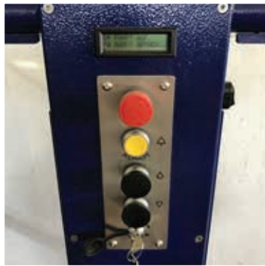
Steuerung der Plattform mit Stop- und Alarm-Taster sowie Display für Status- und Fehleranzeige