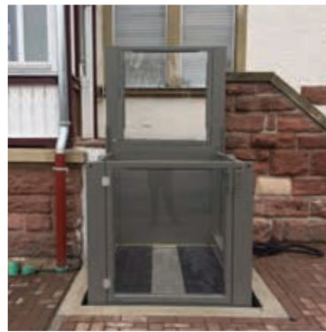
Installation in einer Grube mit einer Tür an der unteren Haltestelle