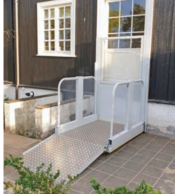
Anlage ist in jeder RAL-Farbe verfügbar, Standardfarben sind RAL 9007 und 7035